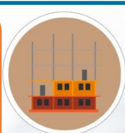
預售屋成交資訊申報