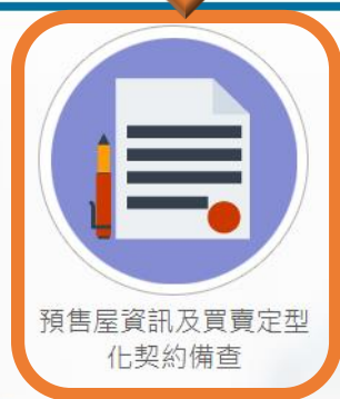
預售屋資訊及買賣定型 化契約備查