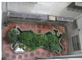
中庭水池易生病媒蚊