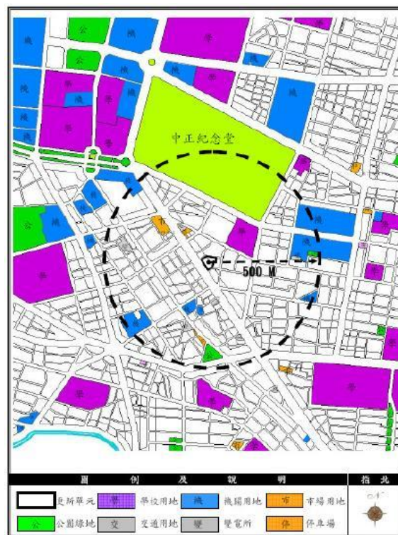
周邊公共設施及觀光景點分