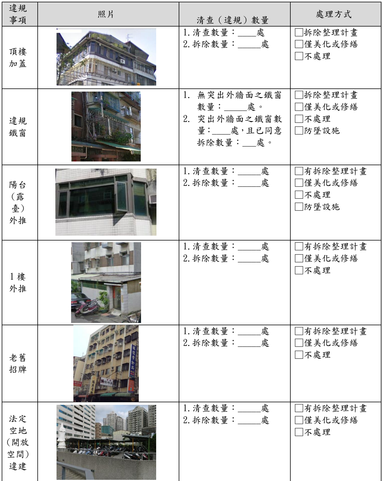
表 3-1 違建及違規物分析表