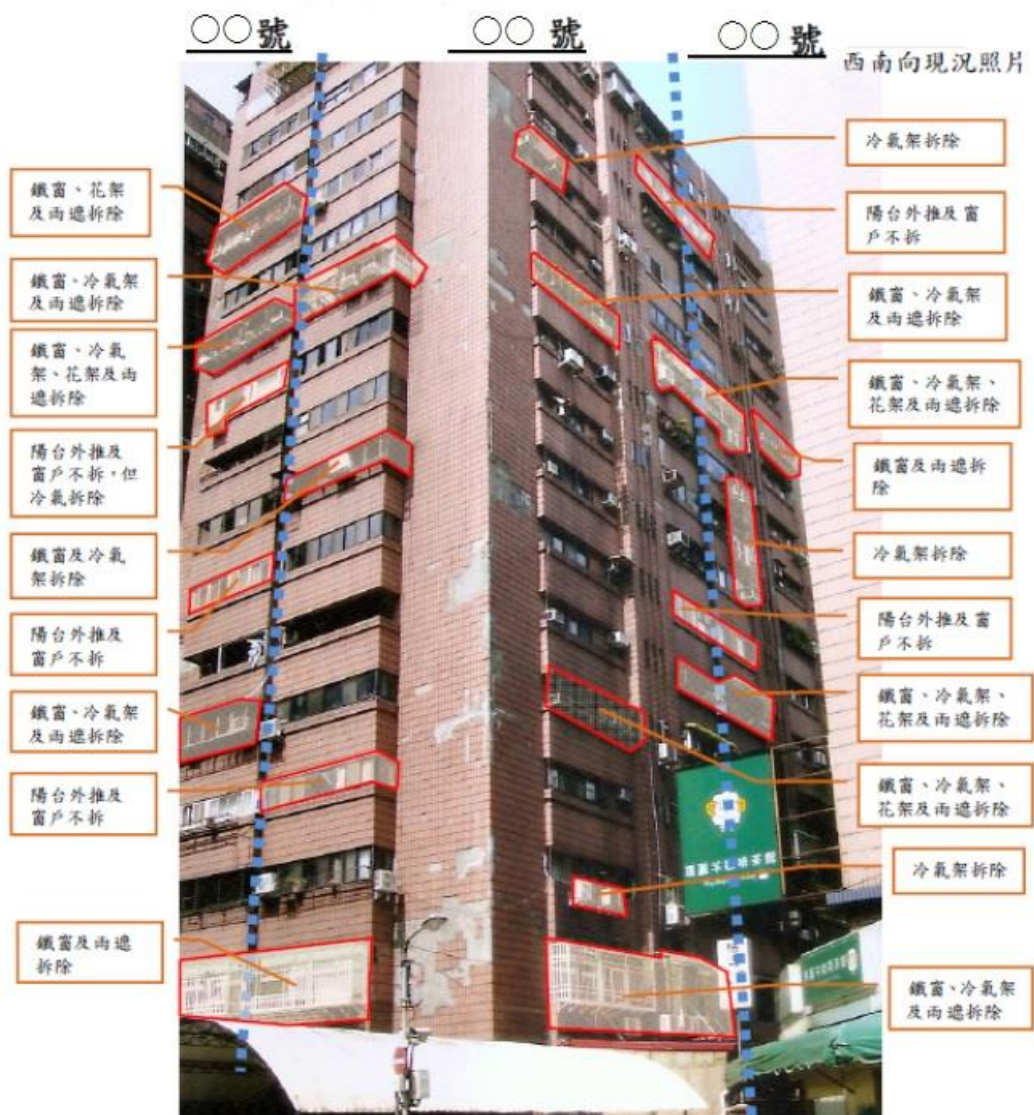
圖 3-1 違建及違規物拆除意願結果分析圖