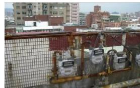
屋頂瓦斯表及管線