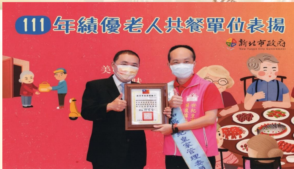
111年績優老人共餐單位表揚 111.8.25