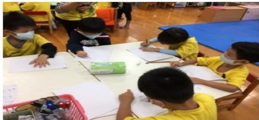
圖說：孩子描繪出心中的醜泥怪。