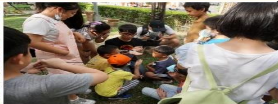
圖說：生態講師猴子老師與同學們走訪瓦礫溝民族公園段進行生態觀察。