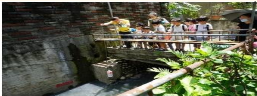
圖說：在地圖中消失的瓦礫溝—智光街路段，取水採樣後將進行水質檢測。