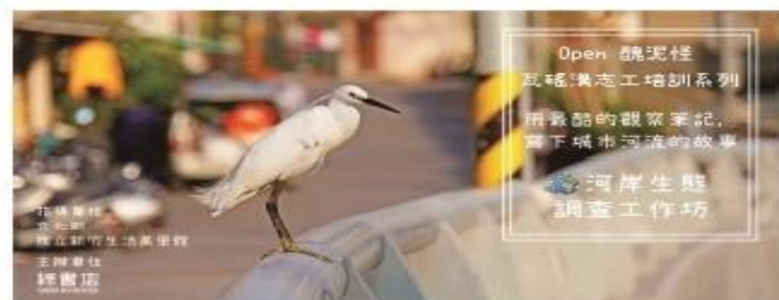
圖說：說故事志工招募活動 BANNER