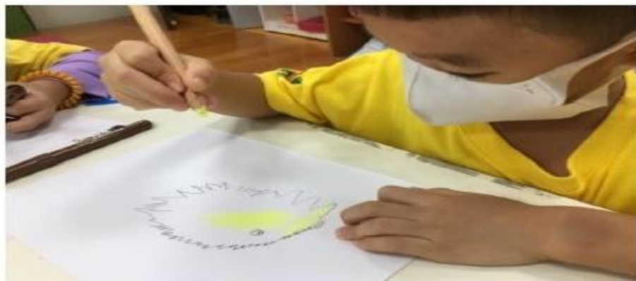
圖說：醜泥怪的樣子各有獨特之處。