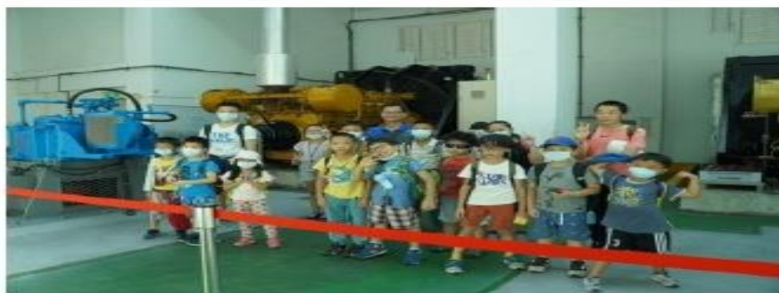
圖說：中和二抽水站戶外參訪學習活動。