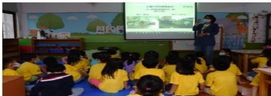
圖說：聽完故事後，認識河流現況。