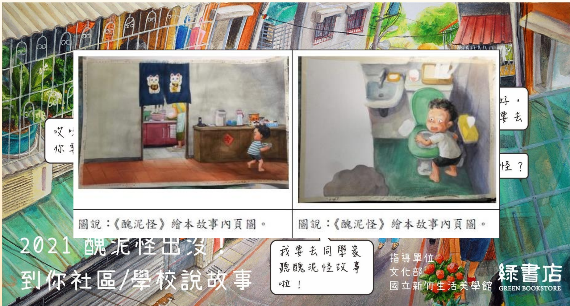
圖說：《醜泥怪》繪本故事內頁圖。