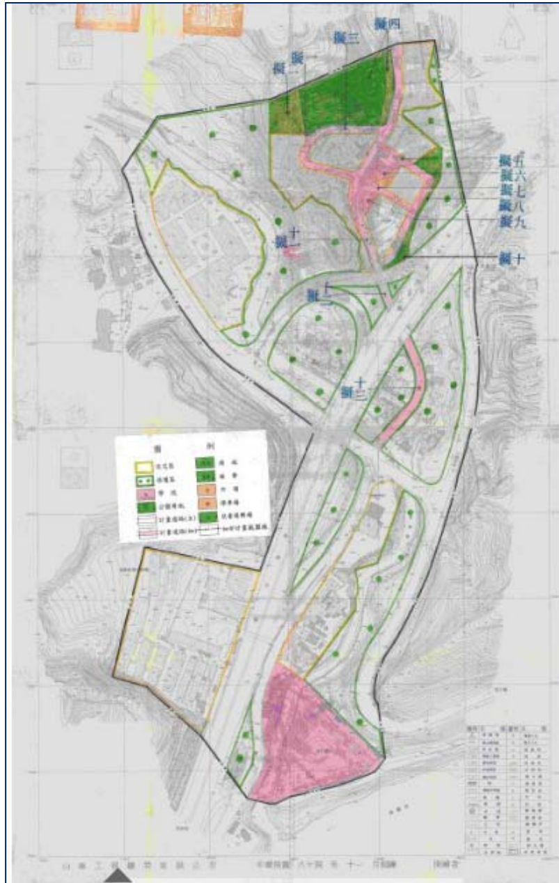
圖三 擬定基隆市七堵暖暖地區(八堵交流道附近地區)細部計畫案示意圖