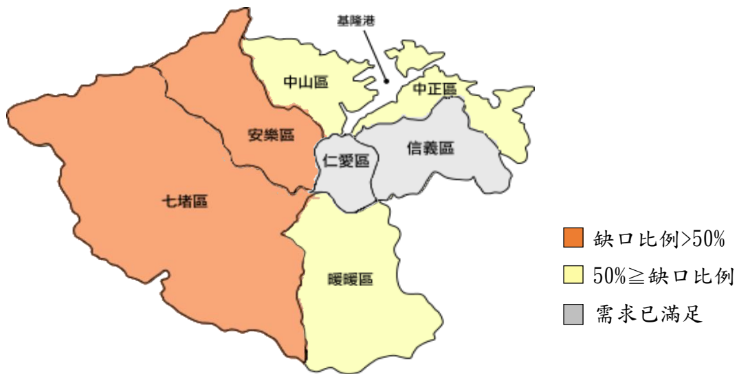
圖 6. 日間照顧機構布建缺口示意圖