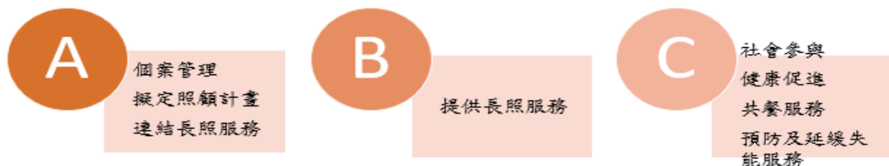
圖 1.長照 ABC 分工

現階段長照服務體系分為 A、B、C 三級，由 A 級（社區整合型服務中心）負責擬定照顧計畫與連結服務，B 級（複合型服務中心）提供各項長照服務，C 級（巷弄長照站）讓長者就近參與健康促進、預防及延緩失能活動。截至 114 年 6 月底，本市長期照顧資源已布建 8A-274B-78C，相較於 111 年底 7A-128B-60C，成長 1A-146B-18C，其中以服務提供單位(B 單位)成長率達 114%為最為顯著。