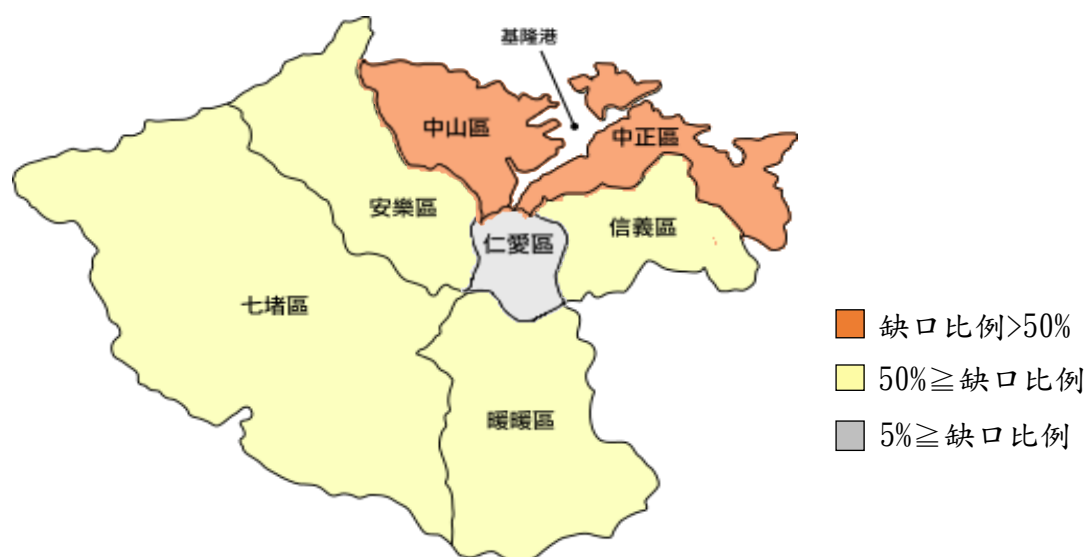
圖 7. 住宿式機構布建缺口示意圖