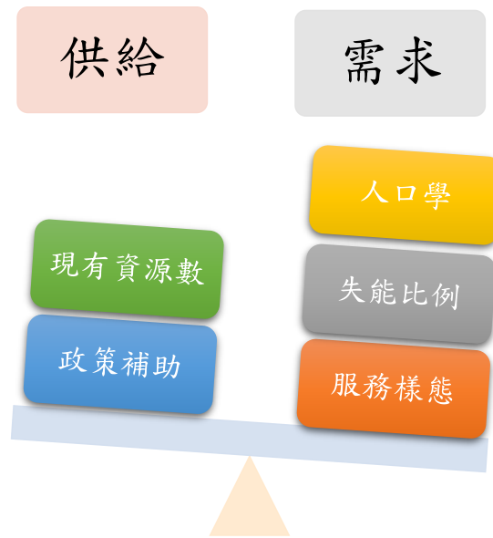
圖 2. 長照服務供需影響因子

本研究採次級資料研究法，結合衛生福利部照顧管理資訊平台數據、公開資料與政策評估，探討本市長期照顧需求及資源布建之落差，以作為本市長期照顧資源布建規劃方向之參考。