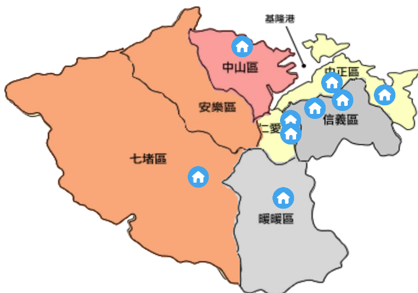
圖 3. 本市日間照顧中心位置圖

另配合衛生福利部一國中學區日照政策，本市計 15 個國中學區，已完成 9 個國中學區設立，5 個學區設立中，學區達成率為 87%。