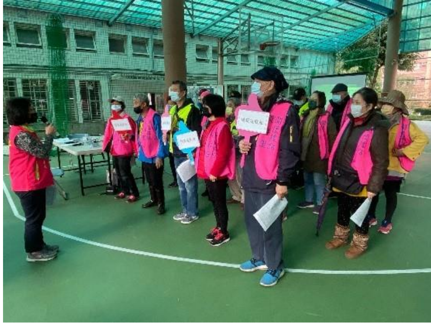
圖 24：暖暖區碇祥里韌性社區演練