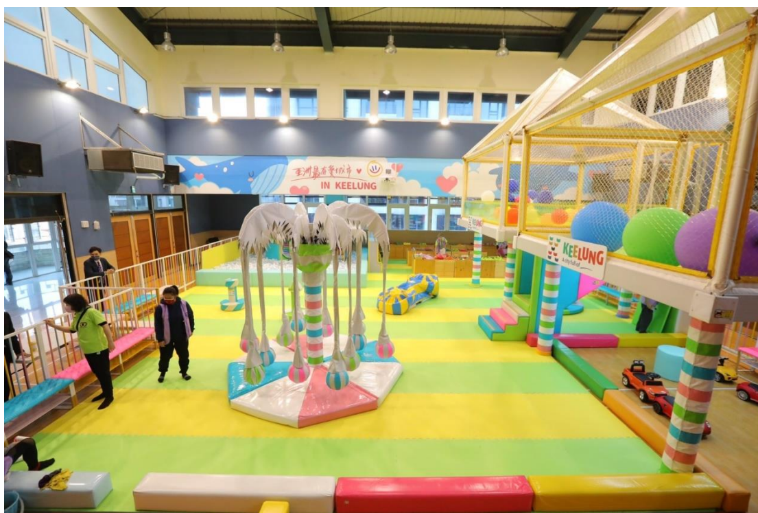
圖 3：信義室內兒童樂園於 112 年 3 月 30 日正式啟用

本案所需經費含消安檢查、既有場地修繕、補助民間團體協助營運費用、線上預約資訊設備、購置機械式及充氣式遊具、架設監視系統等，總計 2 千 5 百萬元經費，將於本次定期會中提出追加預算，懇請議會給予支持。