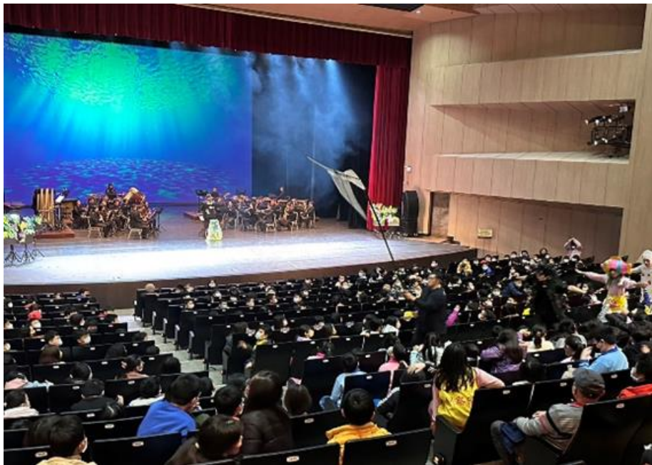
圖 18：本市藝術教育劇場落實文化均權

採購案已於 112 年 3 月 22 日議價完成，將由本市傑出演藝團隊慾望劇團創作之《小灰俠》為節目，故事扣合基隆在地文化風情，讓學生更能融入劇情。