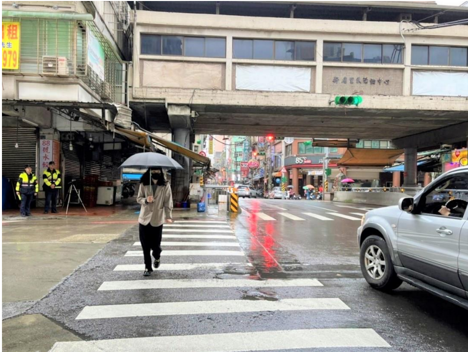
圖 1：「行人友善」政策警察宣導及執法情形