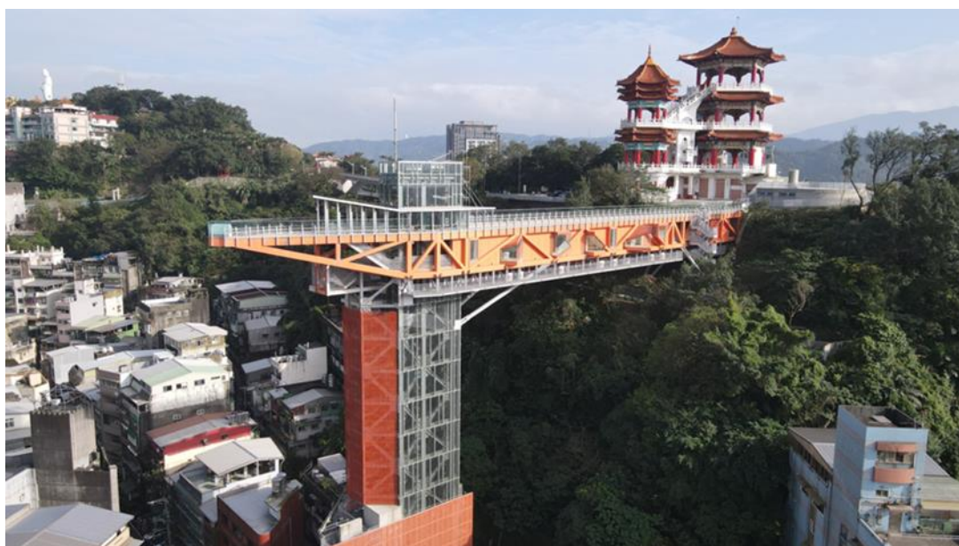
圖 7：基隆塔目前施工現況照片

本工程未來將是國內、外旅客參觀及服務在地市民之基隆新地標，本府將採取嚴格標準審視工程驗收缺失問題，並積極列管以確保工程安全無虞、提供優質公共設施。待驗收完成後，將辦理招商營運再對外正式開放。