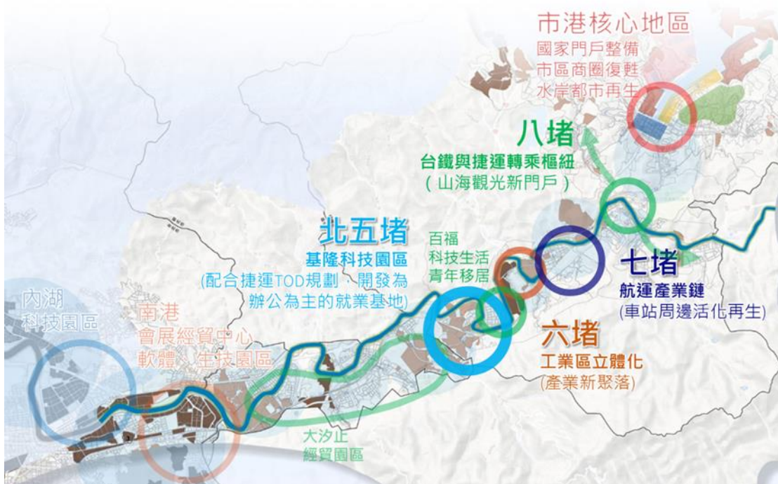
圖 11：基隆捷運沿線各場站空間定位