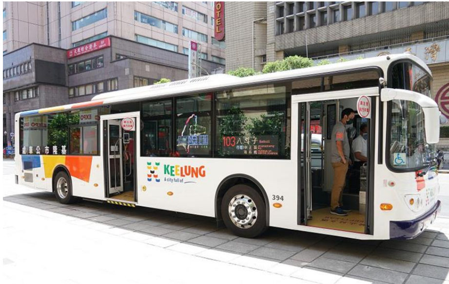
圖 13：本市 112 年將新購置 6 輛低地板公車

111 年 11 月 21 日決標，合約訂於 112 年 8 月 31 日前交車。