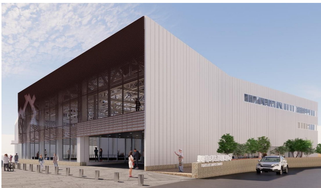
圖 19：「基隆市和平島 B 考古遺址」解說中心工程示意圖

為提供永續保存考古遺址之空間，規劃地上三層建築，採用鋼骨大跨距，減少落柱，優先保護考古遺址坑，並規劃一、二樓展示區及吊橋展示區等空間。