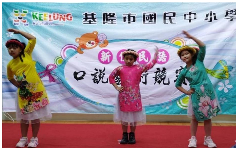
圖 22：基隆市國民中小學新住民語文口說藝術競賽