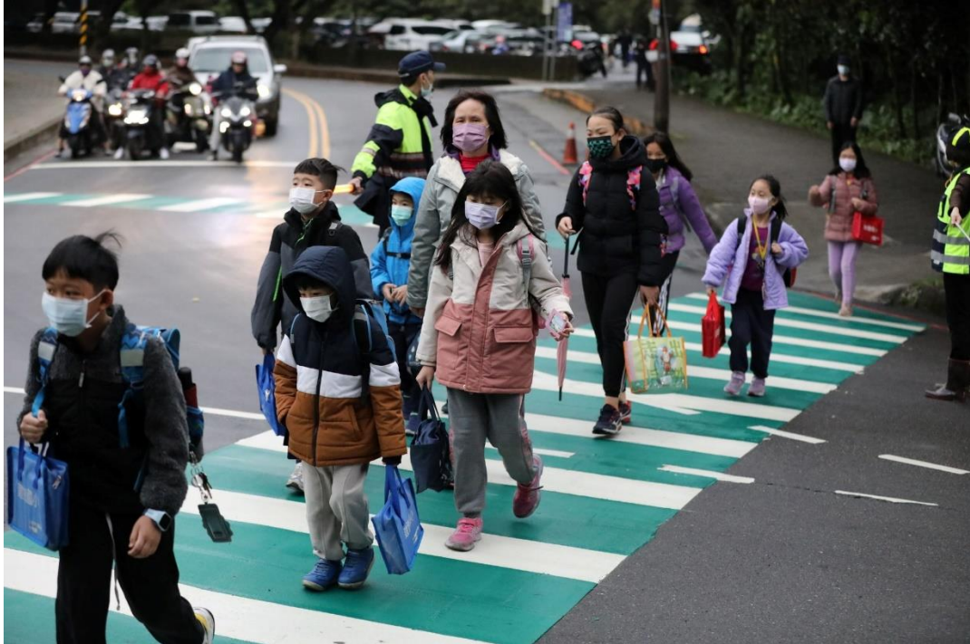
圖 2：「行人友善」政策劃設綠色斑馬線

而為因應兒童節活動及郵輪旅客蒞臨基隆，市府加速進行市區熱點綠底斑馬線劃設，並於各區市場周遭人潮眾多處劃設，截至今(112)年3月23日止，已完成增設8處。