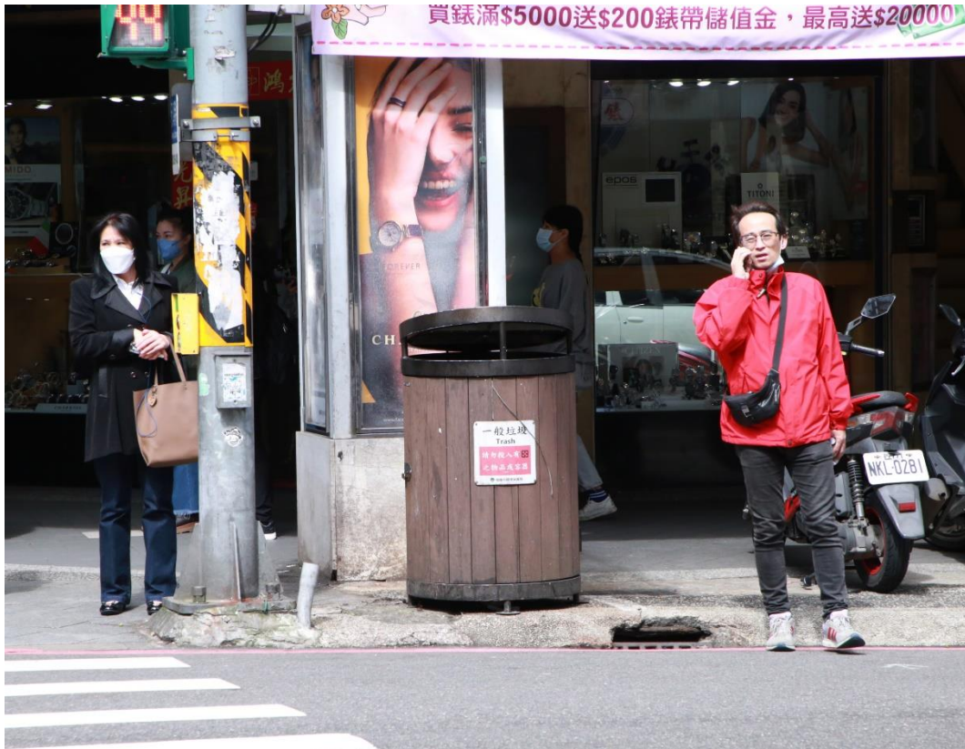
圖 5：「打造乾淨家園」政策，於觀光熱點周邊增設行人專用垃圾桶