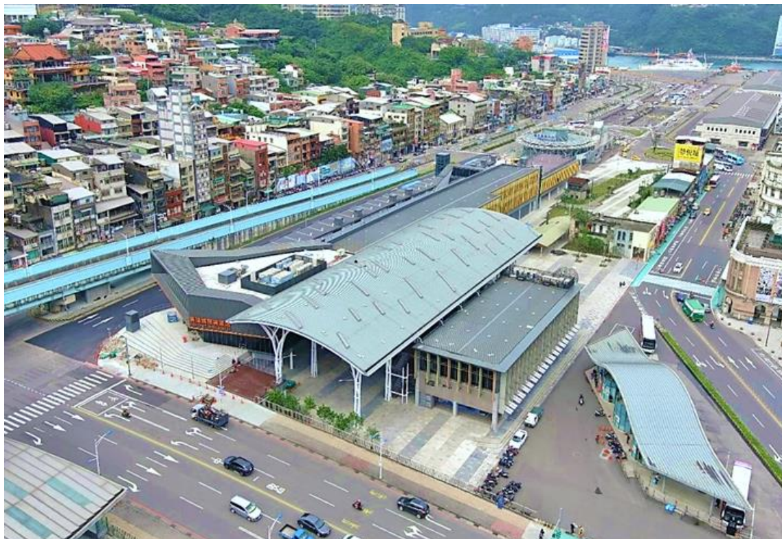
圖 15：基隆城際轉運站空拍照

建轉運站施工進度至 112 年 3 月 31 日止達 99.74%，本府將持續監督工程進度及把關施工品質。