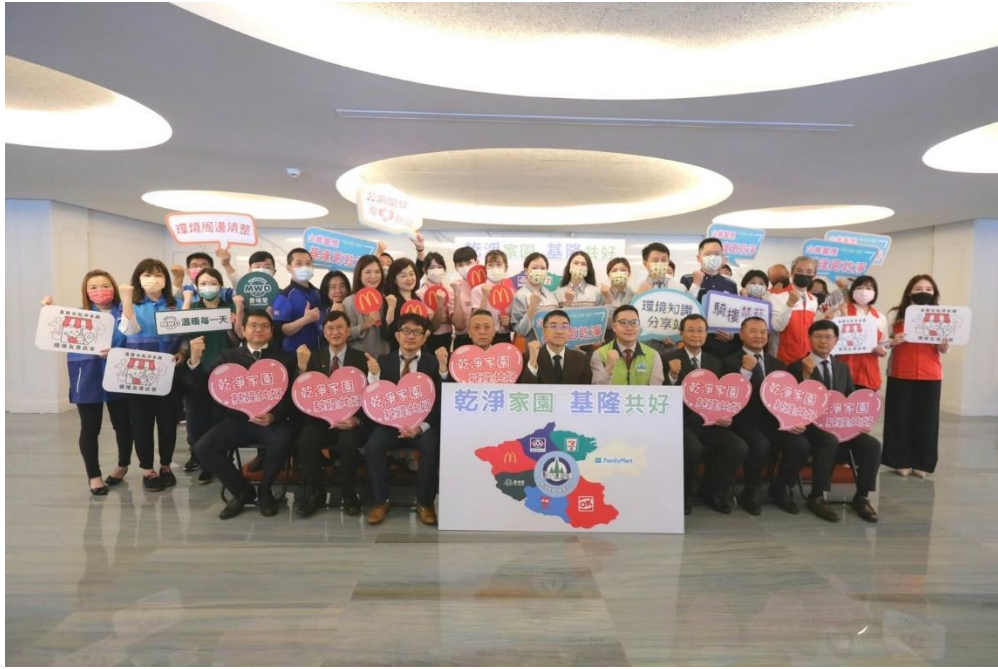
圖 4：市府攜手 7 大企業計 266 家門市店面推動乾淨家園