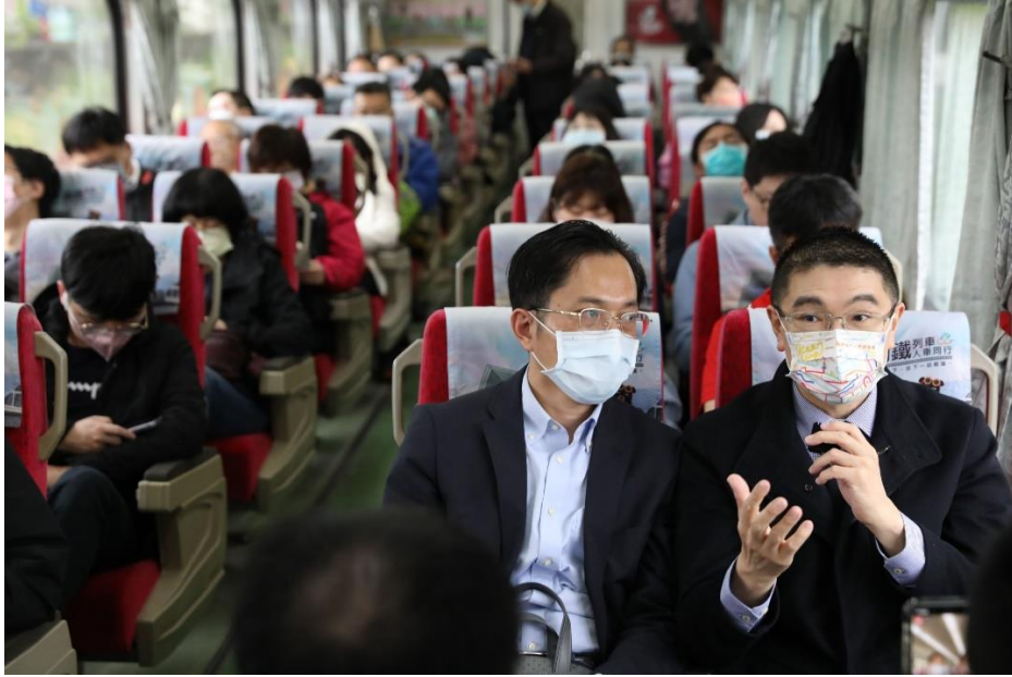
圖 14：關心台鐵通勤族權益，爭取台鐵直達車加停南港站