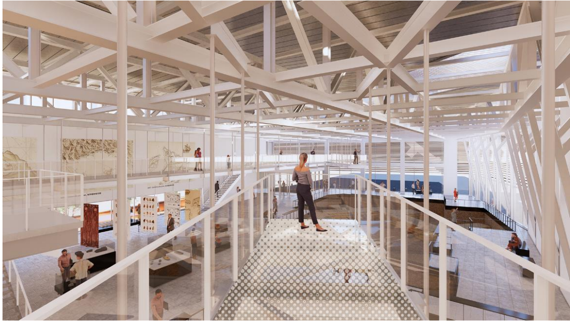
圖 20：「基隆市和平島 B 考古遺址」解說中心工程示意圖