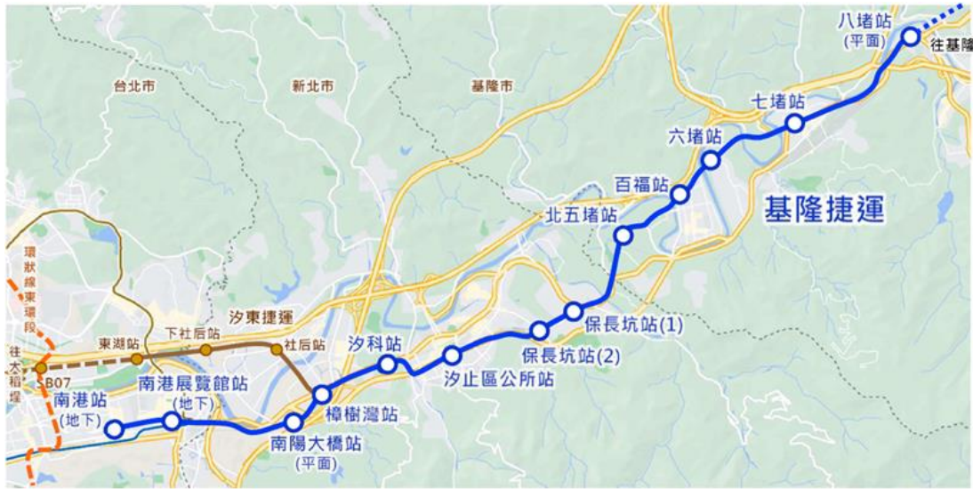
圖 10：基隆捷運路線圖