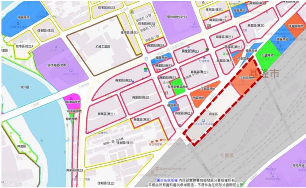
圖 8：七堵火車站前公有土地招商規劃範圍圖