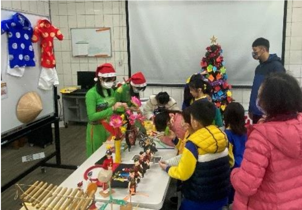
圖 21：本市國小辦理新住民語文樂學活動