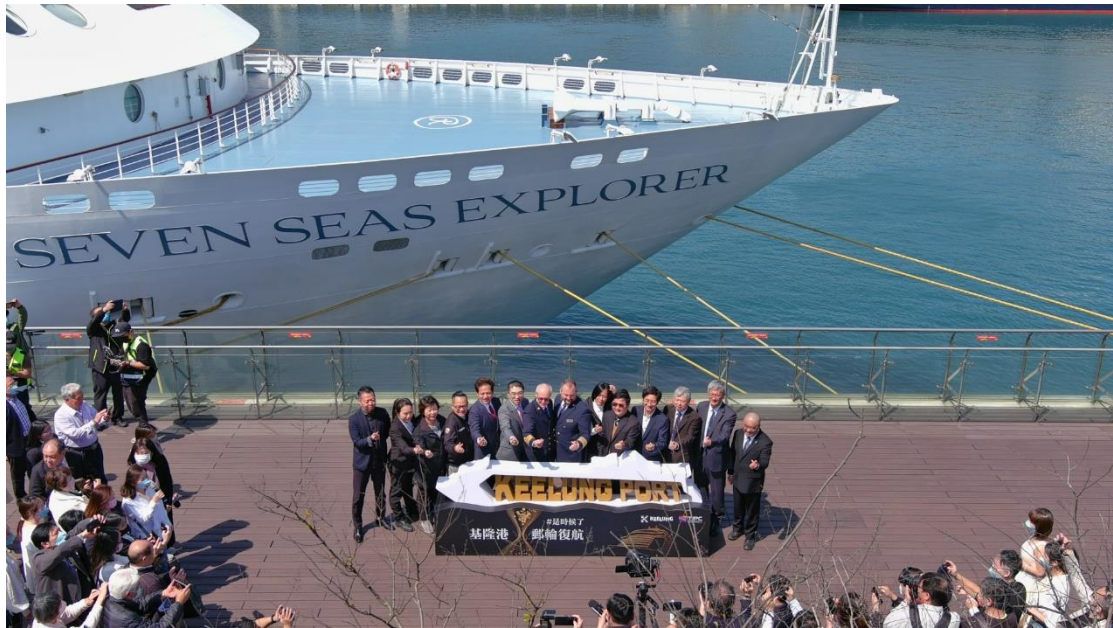
圖 6：國際郵輪 112 年 3 月 7 日復航基隆，辦理首航歡慶活動