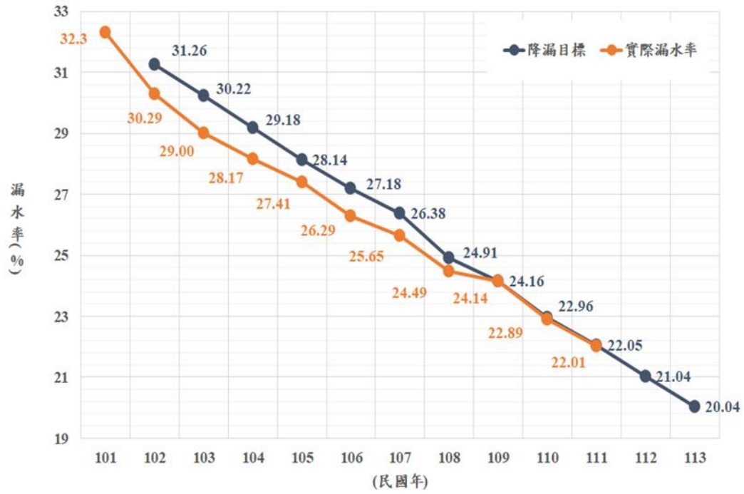
圖 16：基隆地區漏水率下降趨勢圖