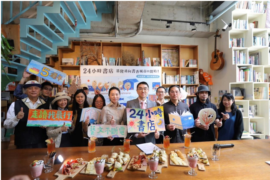
圖 17：市府洽談書店響應市府政策，見書店自112年4月起假日24小時營運

112年4月起與在地見書店洽談響應市府政策，假日擴大營運24小時開放，並推出系列夜間活動；為進一步擴展閱讀場域，並輔導受疫情影響的實體書店等藝文產業，本府112年將爭取追加預算500萬元，辦理「書店及閱讀場域擴大營運及輔導計畫」，針對設籍於本市的實體店家提供營運面的輔導，並協助提出創新服務計畫，也輔導書店以外的產業(如咖啡廳等)，提供閱讀服務。