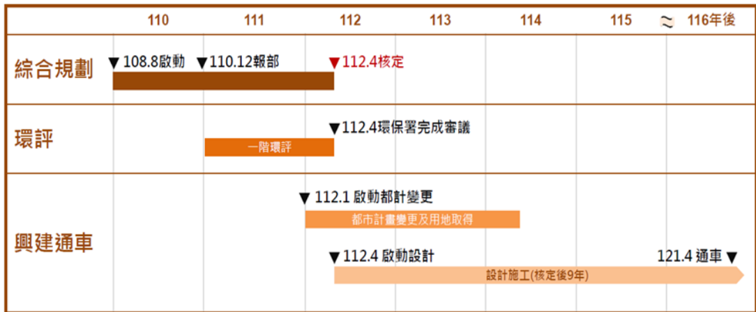
圖 12：基隆捷運綜合規劃預定期程(資料來源：111.2.22 行政院記者會資料)