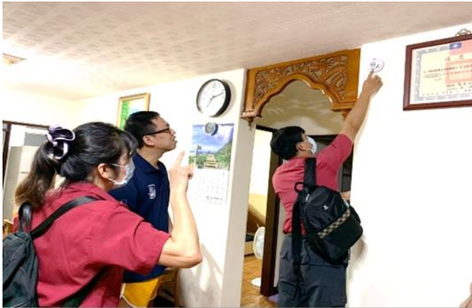
圖 23：協助本市民眾安裝住警器