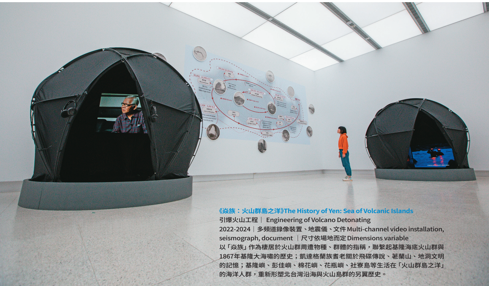
《焱族：火山群島之洋》The History of Yen: Sea of Volcanic Islands 引爆火山工程 | Engineering of Volcano Detonating 2022-2024 | 多頻道錄像裝置、地震儀、文件 Multi-channel video installation, seismograph, document | 尺寸依場地而定 Dimensions variable 以「焱族」作為棲居於火山群周遭物種、群體的指稱，聯繫起基隆海底火山群與1867年基隆大海嘯的歷史；凱達格蘭族耆老關於飛碟傳說、荖蘭山、地洞文明的記憶；基隆嶼、彭佳嶼、棉花嶼、花瓶嶼、社寮島等生活在「火山群島之洋」的海洋人群，重新形塑北台灣沿海與火山島群的另翼歷史。