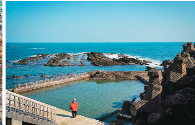
↑海興游泳池是由天然海岸建造而成。

「基隆孩子是在海裡學會游泳，而不是游泳池。」基隆市府年初時宣布重新開放位於外木山海岸，由民眾運用海岸地形、自行打造而成的「海興游泳池」。