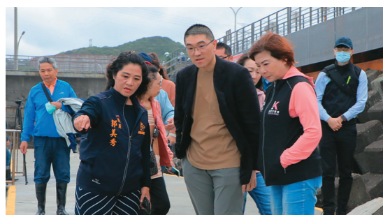
←市長謝國樑(右3)前往外木山海興游泳池會勘。

「海興游泳池」今年1月重新開放讓民眾下水，愛好晨泳及海上遊憩的人們得知後，立馬前來跳進海中，在無邊際的游泳池，體驗在大海裡泅泳的快感。