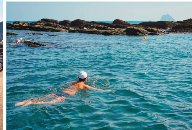
↓ 清澈水域是專屬於基隆在地人的私房海水游泳池。