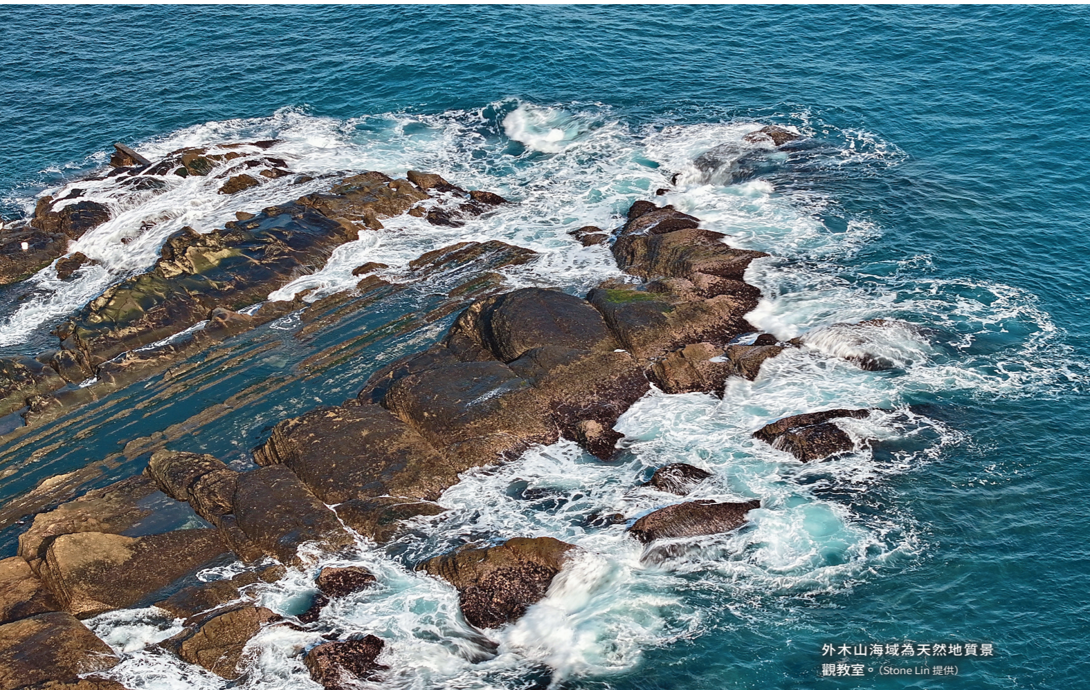
外木山海域為天然地質景觀教室。