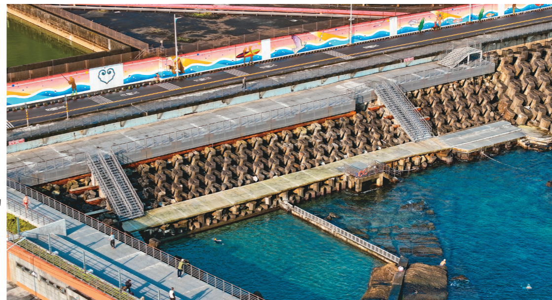
→游泳池周邊修繕完工後的空拍景觀。

「海興游泳池」今年1月重新開放讓民眾下水，愛好晨泳及海上遊憩的人們得知後，立馬前來跳進海中，在無邊際的游泳池，體驗在大海裡泅泳的快感。