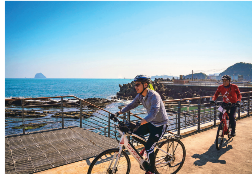
← 外木山自行車道途經的海興游泳池為高人氣熱點。

產發處表示，海興游泳池為開放水域，市府將針對人工設施持續改善，另外考慮到水域多有岩石、暗礁、海漂物及暗流，呼籲民眾前往該處從事水域活動留心自身安全。