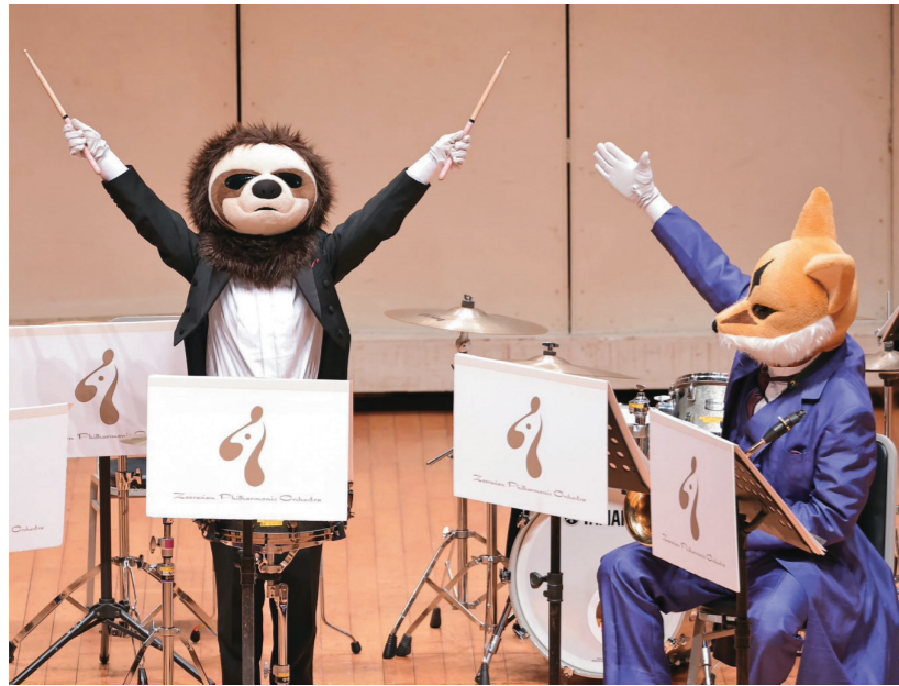
↑日本音樂的繪本—動物樂團用生動活潑的演奏，帶領大小朋友進入古典音樂的世界。

今年不一樣的是將音樂饗宴帶入基隆童話藝術節，由文化局與教育處攜手合作推出的「日本音樂的繪本—動物樂團『一童搖擺』親子音樂會」，4月5日在基隆表演藝術中心演藝廳登場。