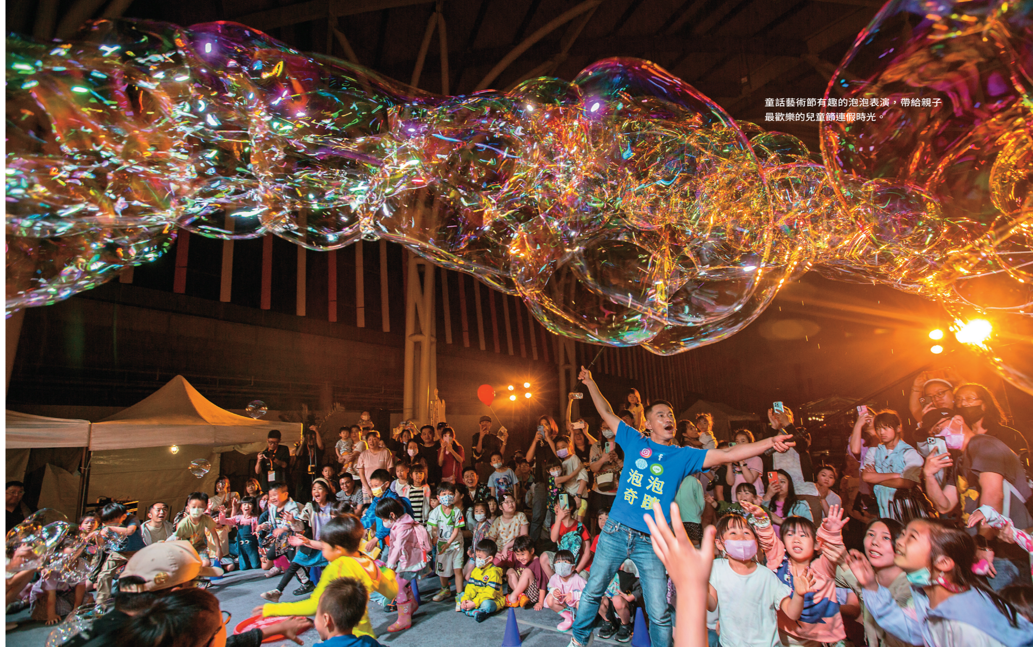
童話藝術節有趣的泡泡表演，帶給親子最歡樂的兒童節連假時光。