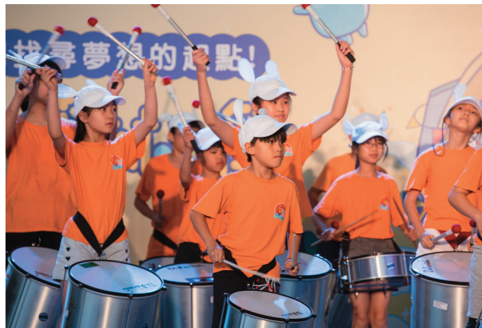
↑基隆童話藝術節4月4日起在城際轉運站正式啟動，開幕當晚以各項精彩舞台表演展開序幕。