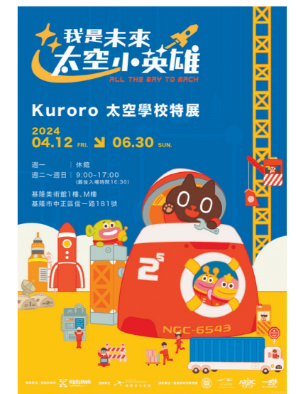
↑文化局推出 KURORO 太空學校展覽，展期至6月30日止。

2024基隆童話藝術節系列活動壓軸的是4月20日及4月21日登場的「大班作品展+親子DIY探索體驗」，在基隆市文化局外牆、基隆最大影幕牆展示作品，讓基隆人驕傲地一同見證孩子們的藝術天分。