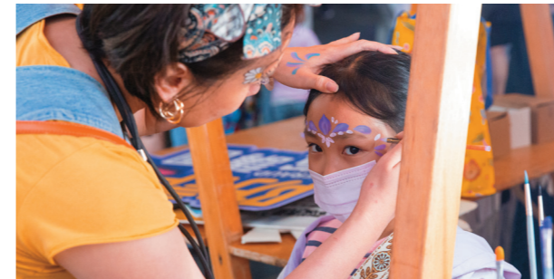
↑童話藝術節的風格市集與工作坊吸引孩童熱烈參與。