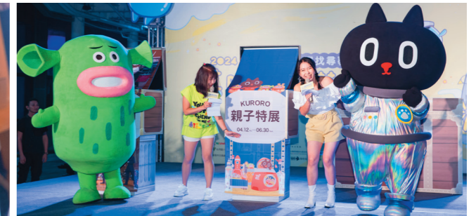
↑台灣知名IP「宇宙喵 Kuroro」為基隆美術館舉辦《我是未來太空小英雄！》特展宣傳。