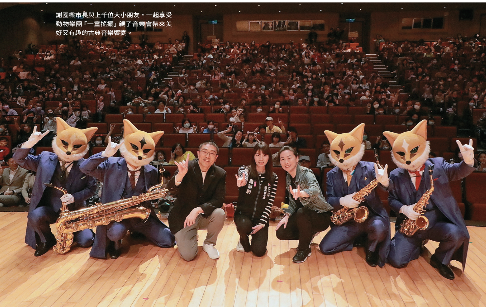
謝國樑市長與上千位大小朋友，一起享受動物樂團「一童搖擺」親子音樂會帶來美好又有興趣的古典音樂饗宴。

「過去動物樂團從未在6都以外的縣市演出，這麼好的音樂會應該引進基隆。」市長謝國樑表達對音樂活動的熱情與支持。台上狐狸先生們以薩克斯風吹奏樂曲，輕鬆的音樂讓在場所有大人