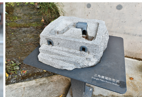
↑三角廣場防空洞的小模型，可藉此一窺防空洞內部廊道。