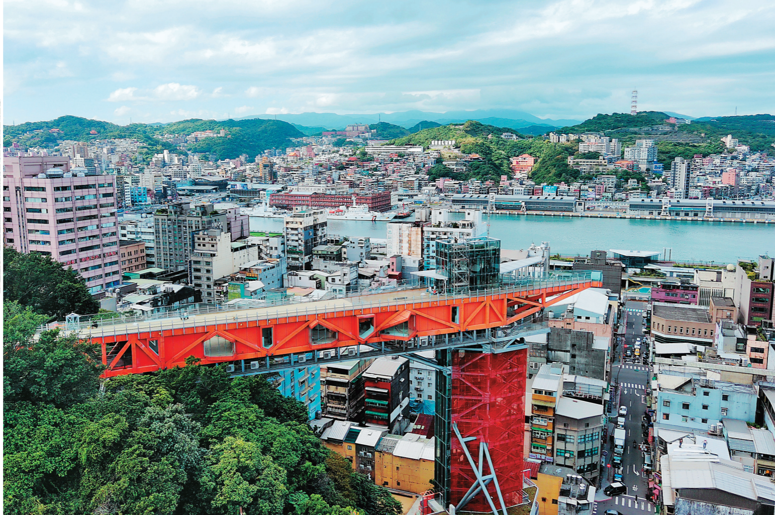
↑「基隆塔」的造型是以港區的「橋式起重機」作為設計發想。

串連山海城的「基隆塔」，12月5日至10日免費開放試營運，天氣一放晴，民眾便相約一同排隊探索這座城市的新地標之美；遠見人文空間也進駐基隆塔，連同義二商圈導覽系統，走一遍義二商圈、來一趟登高望遠之旅，看看不一樣的基隆視角，領略人文風情。