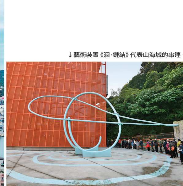
↓藝術裝置《河·鏈結》代表山海城的串連。