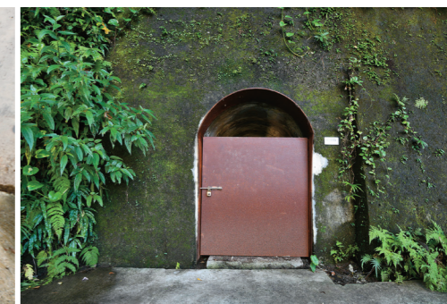
↑「三角廣場防空洞」的入口。