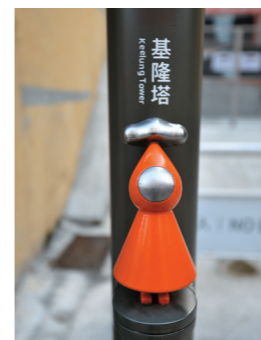
↑傘人家族是基隆的城市指標系統。

基隆塔為垂直公共交通系統一環，藉由串連義二路商圈、雞籠中元文化館和中正公園，活絡當地觀光發展並傳遞地方風貌。基隆借鏡國際海港城市發展模式，善用地利優勢，建立潛力無窮的「垂直觀光城市」新地標，實現「在基隆看見世界·讓世界看見基隆」。