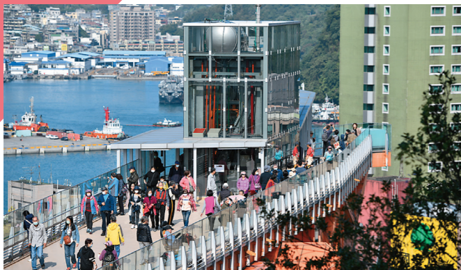
↑基隆塔開放試營運，人潮湧入空中廊道，欣賞基隆港區景致。

串連山海城的「基隆塔」，12月5日至10日免費開放試營運，天氣一放晴，民眾便相約一同排隊探索這座城市的新地標之美；遠見人文空間也進駐基隆塔，連同義二商圈導覽系統，走一遍義二商圈、來一趟登高望遠之旅，看看不一樣的基隆視角，領略人文風情。