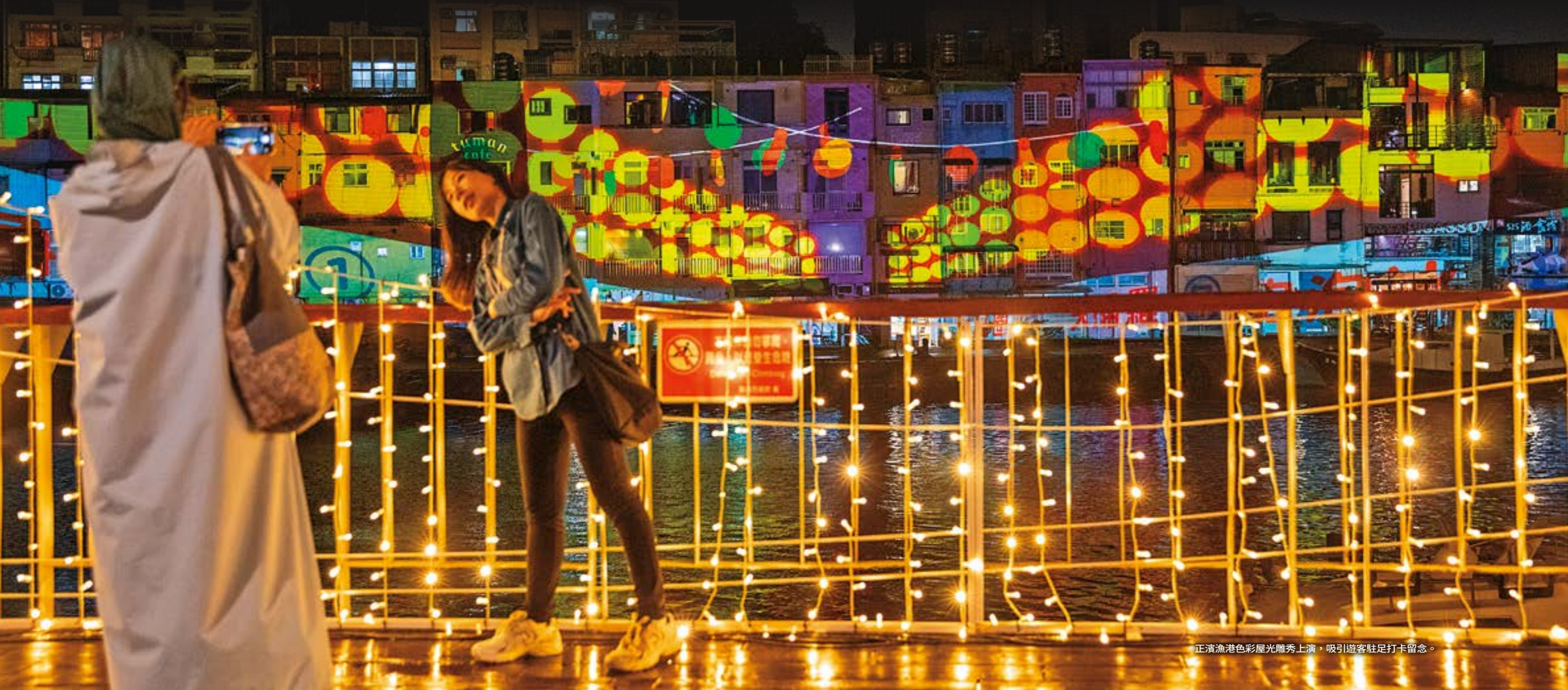
正濱漁港色彩屋光雕秀上演，吸引遊客駐足打卡留念。