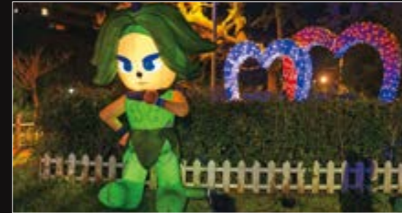
1. 有增長術能力的「嘎嘎」，在暖暖區的暖心公園以光影魔法陪伴大夥兒尋寶。 2. 「艾里」守護在安樂婦幼館前，為社區帶來歡樂。

走完這7區，對基隆的印象可不再只是廟口夜市了，從AR城市尋寶遊戲，你將會發現更多基隆不言而喻的美好，值得與眾親友好好分享。