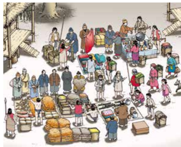
↑ 16世紀雞籠成為東亞國際貿易轉運站。

1642年8月，荷蘭人派出700人艦隊抵達雞籠，不從正面攻打蓋在島上的聖薩爾瓦多城，而是繞到東岸登陸上山（今東砲台位置），從山上砲擊堡壘及城堡，西班牙人投降。