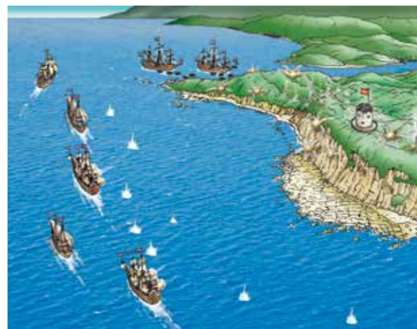
↑ 1642年8月，荷蘭派艦隊攻打島上的聖薩爾瓦多城。