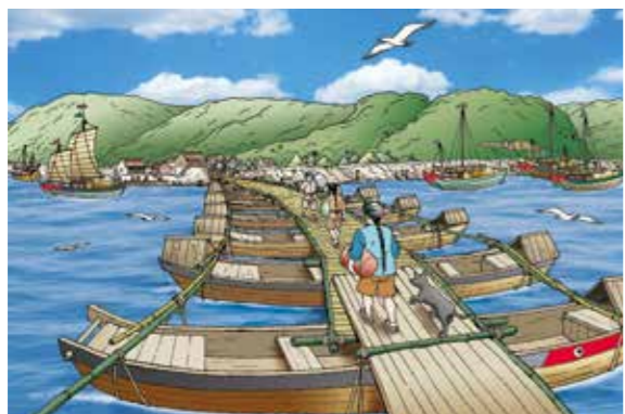
↑ 社寮浮橋以舢舨並排相連、上鋪木板，連接社寮與基隆陸地，可供人與貨物通行。

連、上鋪木板，連接社寮與基隆陸地，可供人與貨物通行。浮橋是中國自古就有的簡易造橋，但在台灣很少見，搭建在海上的社寮浮橋更是僅見。