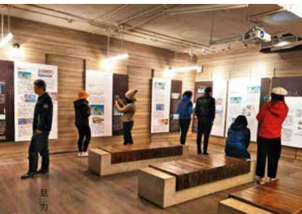
↑ 小島大歷史展覽現場，讓遊客能夠一窺和平島數百年來的歷史進程。

和平島與基隆陸地相隔約75公尺的狹窄水道，以橋連通，是距離台灣本島最近的離島，雖然面積僅0.66平方公里，卻擁有富饒的海洋物產、壯麗的地質景觀，且因獨特的地理位置，在歷史上成為國際族群活躍的舞台，累積豐厚的文化，堪稱台灣多元族群文化的縮影。