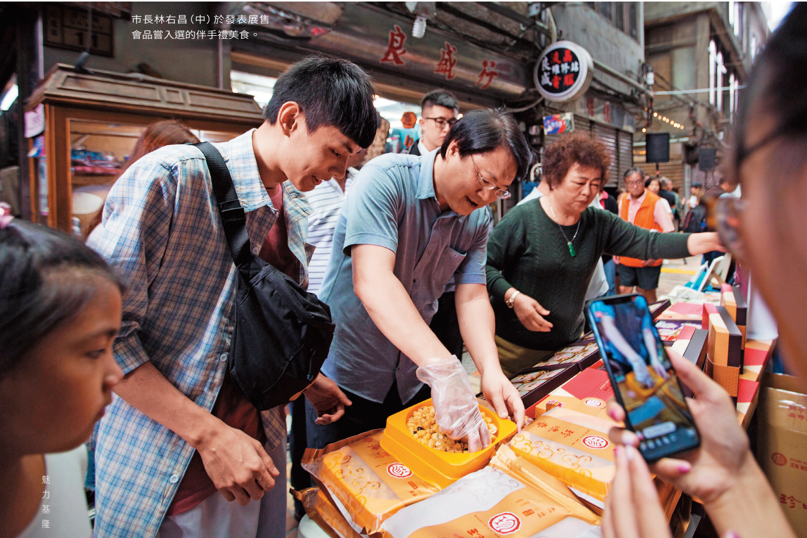
市長林右昌(中)於發表展售會品嘗入選的伴手禮美食。

林市長指出，這屆伴手禮選拔讓他非常驚豔，參賽產品內容更多元，經過大家的努力，激發出新企業、新產品想法，擴大商機的同時，也讓城市更有吸引力。