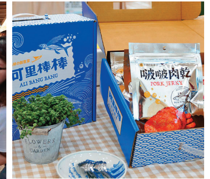
↑ 「阿里棒棒啾啾肉乾」汁多味美，一吃就停不下來。