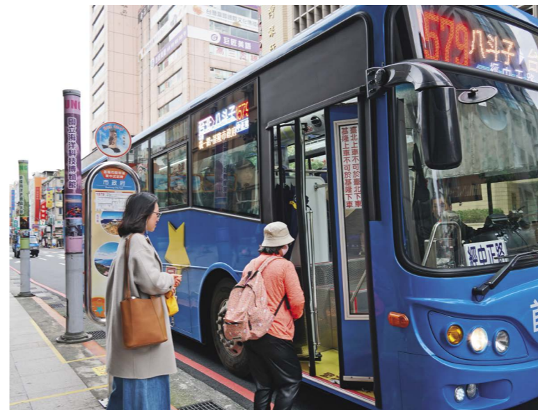
↑ 公車路線開通，讓民眾生活更加便利。

市府特別呼籲，民眾搭乘大眾運輸的意願提高，就是讓業者投入經營的最大動力。公共運輸的推動，實為提升城市宜居性的重要環節，也期望首都客運能提供市民高品質、高安全性的服務，讓通勤的市民及觀光的遊客更便捷省時。