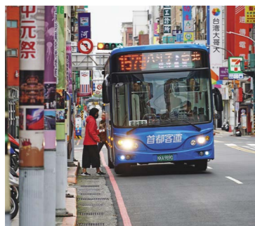
↑ 快捷公車1579號預計可為民眾減省20至30分鐘的通勤時間。

基隆市第3條快捷公車1579中正線，10月15日正式通車營運，未來將由首都客運提供服務，以密集班次往返台北、基隆，讓北北首都生活圈更加完善，通勤觀光更便利。