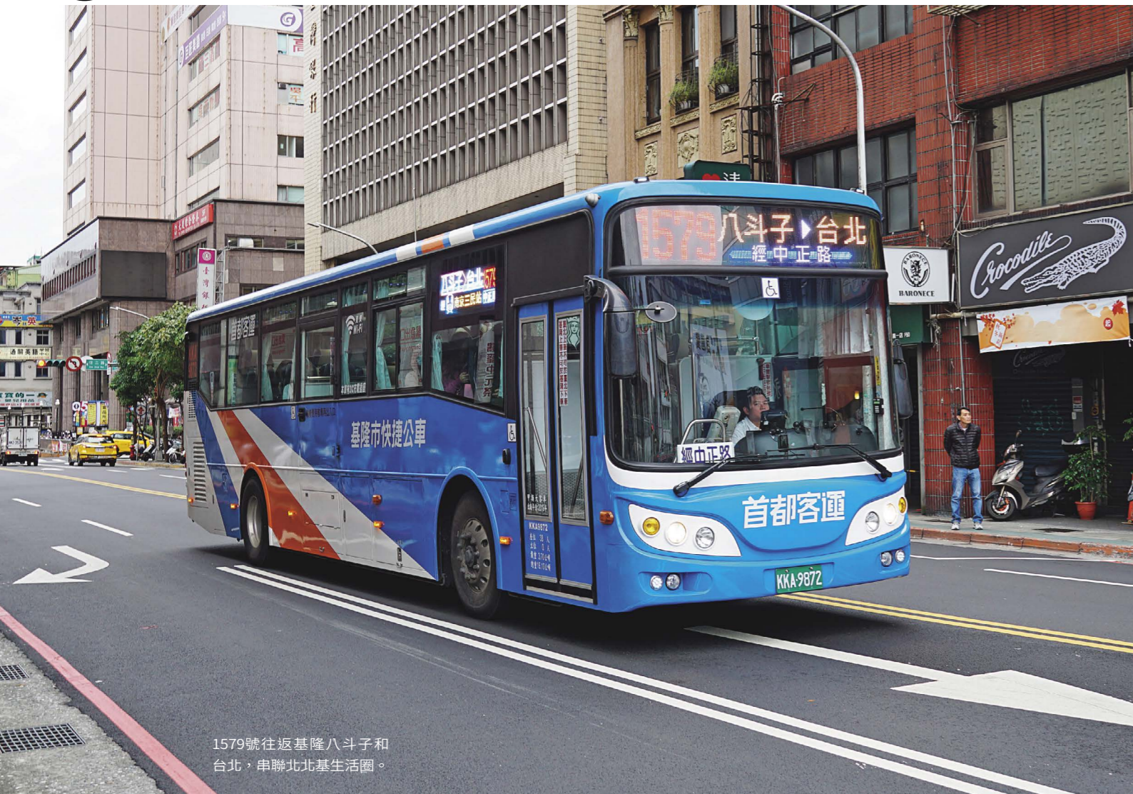
1579號往返基隆八斗子和台北，串聯北北基生活圈。