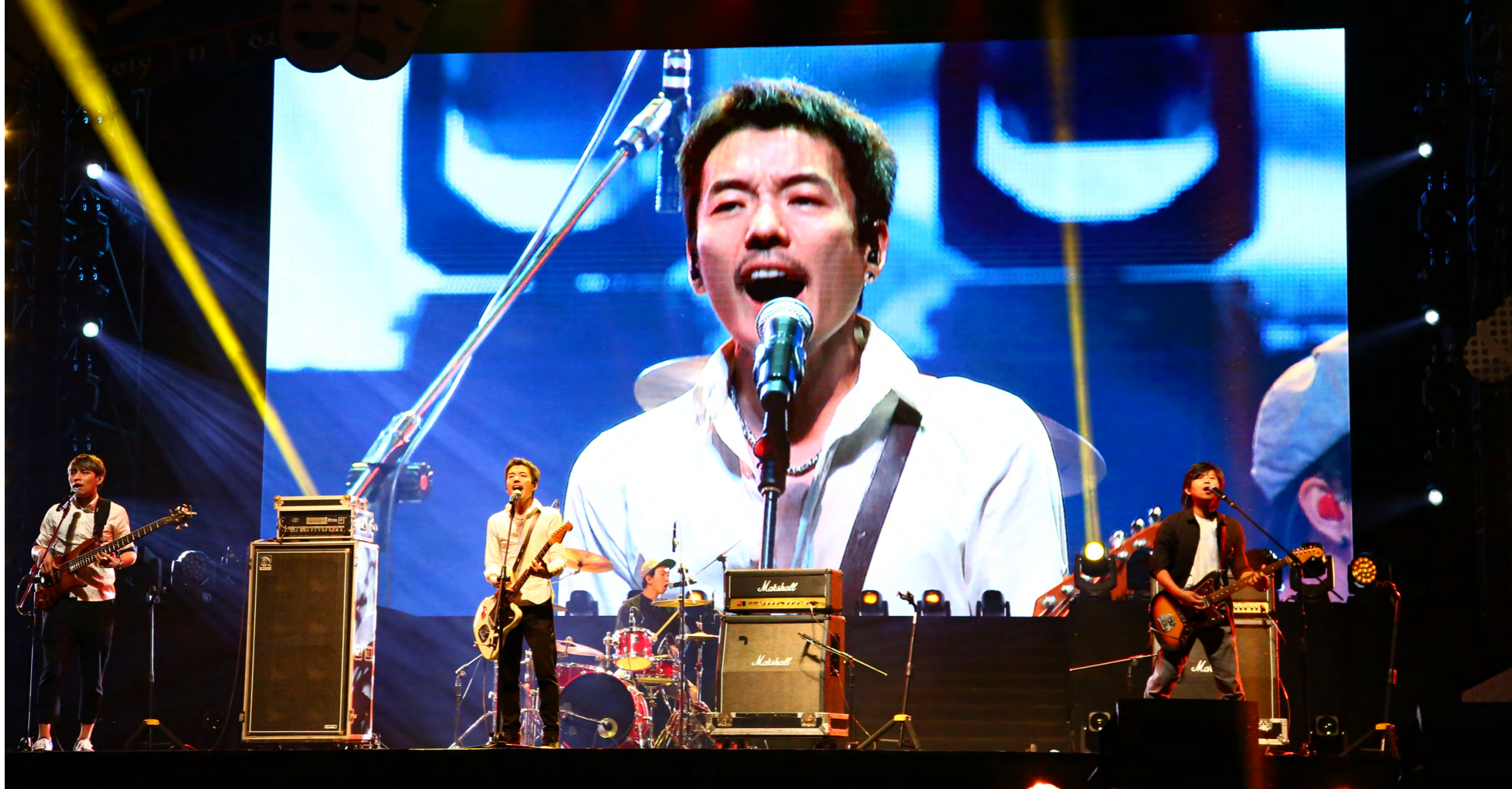
← 四分衛樂團將在跨年晚會上，為觀眾熱力開唱。