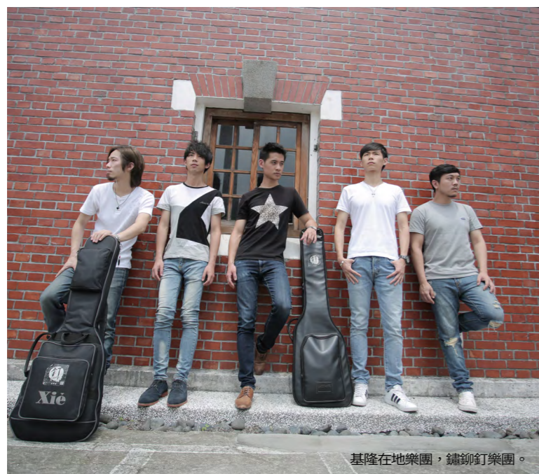
基隆在地樂團，鏽釘樂團。

節目，由DJ「E-Turn」的電音趴熱烈開場，緊接著由鏽釘、拾參樂團、TOBE樂團、血肉果汁機、隨性、美秀集團、旺福及四分衛等樂團，搖滾開唱！