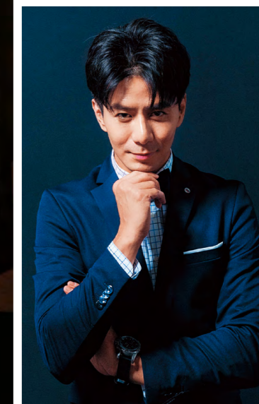
↓ 2019基隆市跨年晚會主持人—郭彥均。