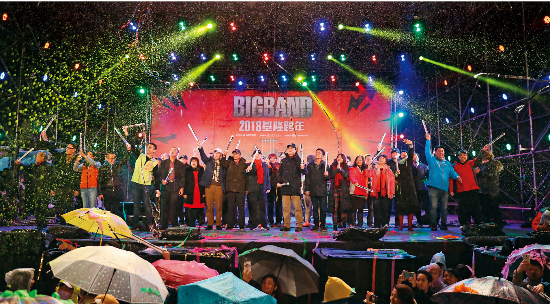
← 市長林右昌與民眾一同倒數，歡樂迎來新年。(2018年資料照)