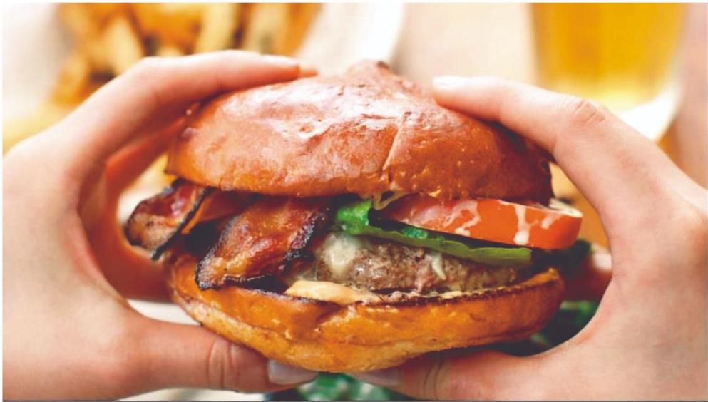
680期2022-8-8 超加工食品 傷腦筋